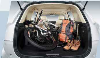
Espace généreux longueur du coffre à 390-1960