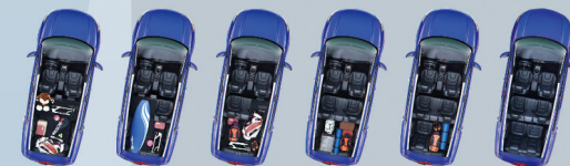
2 à 7 places : Espace multifonctionnel et modulable