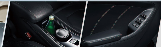
Plus de 30 espaces de rangement