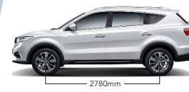
Empattement extra long