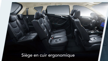
Siège en cuir ergonomique

Générosité et flexibilité des espaces intérieurs font du Glory 580 le SUV idéal pour les sorties en famille ou entre amis. Le Glory 580 facilite la vie au quotidien.