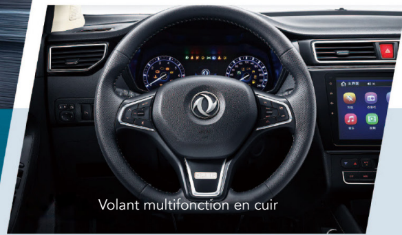
Volant multifonction en cuir