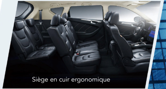
Siège en cuir ergonomique

La Glory 580 est prête à vous accompagner dans chaque moment précieux de votre vie.