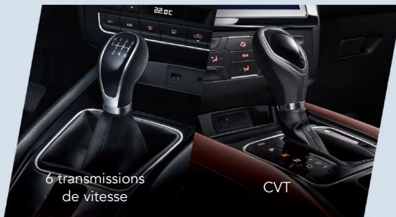
6 transmissions de vitesse