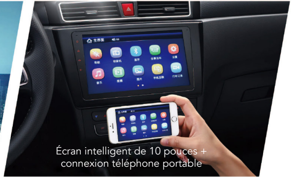
Écran intelligent de 10 pouces + connexion téléphone portable