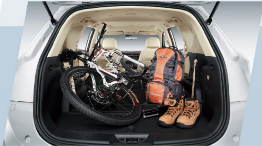
La longueur coffre à 390-1960 crée suffisamment d'espace