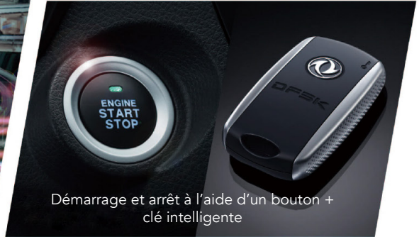
Démarrage et arrêt à l'aide d'un bouton + clé intelligente